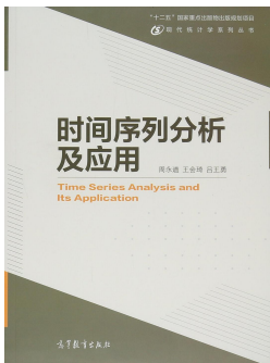
图 3: 时间序列分析及应用